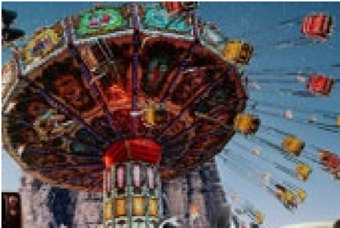
Reporting & Lieferkette