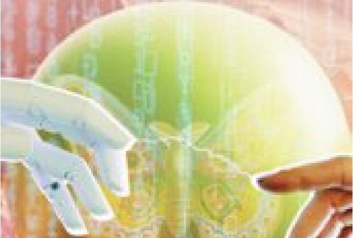
Digitale Transformation & KI