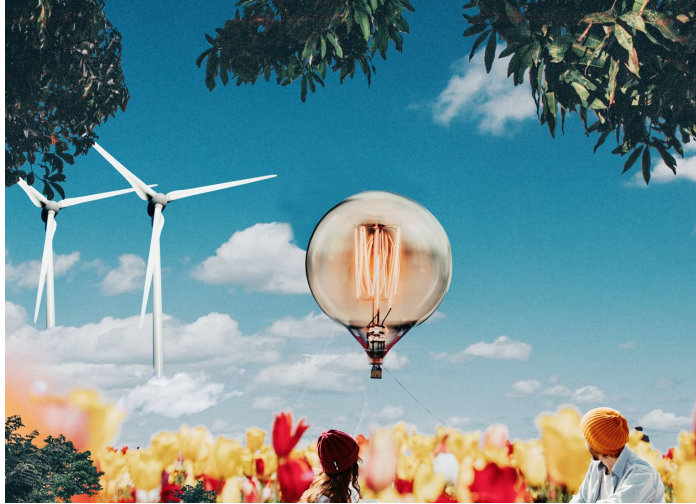
Klima & Energie