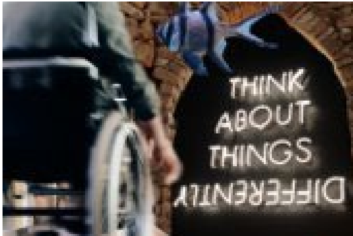
Soziale Nachhaltigkeit (DEI)