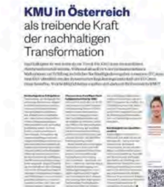
Media Planet 13.12.2024 "KMU in Österreich als treibende Kraft der nachhaltigen Transformation"