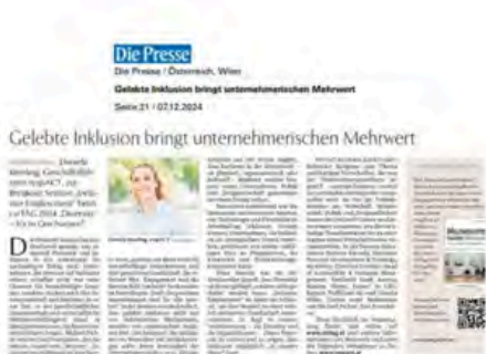
die Presse 07.12.2024 "Gelebte Inklusion bringt unternehmerischen Mehrwert"