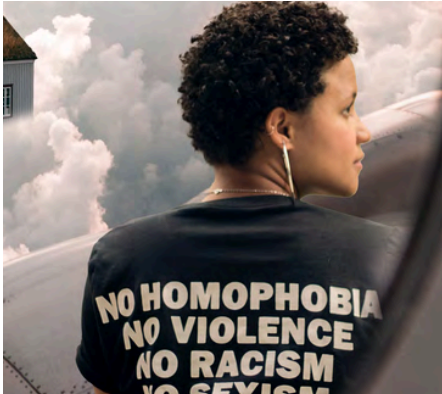
Diversität und Inklusion

Neben ökonomischer und ökologischer begreift respACT auch soziale Nachhaltigkeit als wesentlichen Bestandteil nachhaltigen Wirtschaftens und Handelns. Um Unternehmen Orientierung und Anleitung zu geben, werden nach und nach verschiedenste Aspekte der sozialen Nachhaltigkeit in das Veranstaltungs- und Weiterbildungsangebot integriert. 2024 lag der Fokus dabei auf den Themen Inklusion & Diversität.