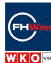
FHWien der WKW Beirat zu Sustainable Finance Management