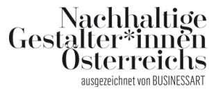
Nachhaltige Gestalter*innen, Jury