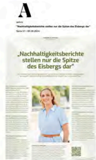
aehre 06.06.2024 "Nachhaltigkeitsberichte stellen nur die Spitze des Eisbergs dar"

Vollständiger Pressespiegel der PRINT CLIPPINGS 2024!