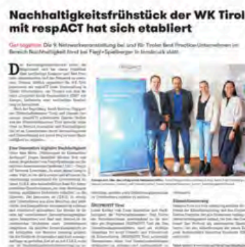
Tiroler Wirtschaft 28.11.2024 "Nachhaltigkeitsfrühstück der WK Tirol mit respACT hat sich etabliert"