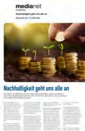
medianet 21.06.2024 "Nachhaltigkeit geht uns alle an"